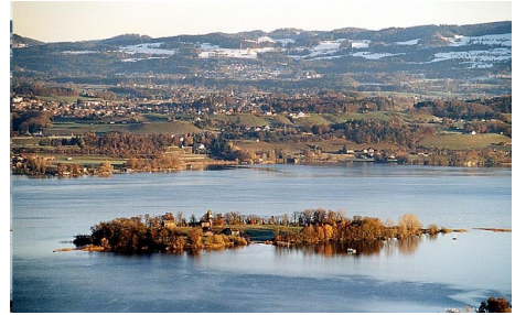
Le lac de Zurich

Zwingli et le conseil municipal s'endurcissent dans leur direction contre la Parole de Dieu et commencent à persécuter ceux qui viendront à être connus comme des ana-baptistes. Emprisonnement, et martyr s'en suivent. Le martyr de Felix Manz, le 5 janvier 1527, par noyade, ouvre le bal.